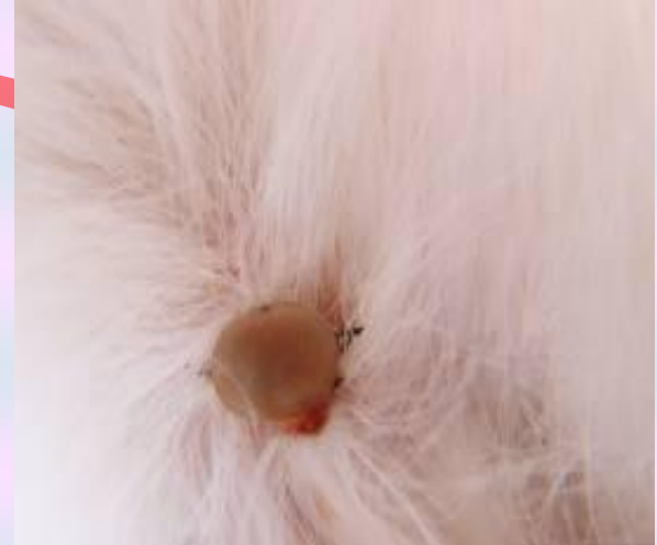
Figure 3 - A female adult dog highly parasitized by R. sanguineus .